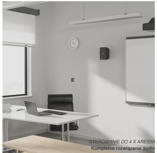
STEROWANIE DO 4 X ARES5A Kompletne rozwiązanie audio

Zdalne połączenie wejściowe realizowane przez złącze RJ45 umożliwia podłączenie panelu ściennego i rozszerzenie systemu za pomocą modułów zdalnego wejścia. Sterowanie maksymalnie 4 zestawami ARES5A (8 głośników) za pomocą zdalnych mikserów ściennych z serii WP2xx.